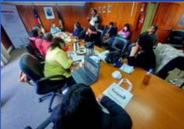
MESA CAMINOS INDÍGENAS - LA UNIÓN

Instancias de coordinación intersectorial y participación comunitaria que buscan mejorar la conectividad y el diálogo directo entre las comunidades y las instituciones. Estas mesas reúnen a representantes de pueblos originarios, autoridades locales y servicios públicos, con la moderación del Plan Buen Vivir y la participación del Ministerio de Obras Públicas.