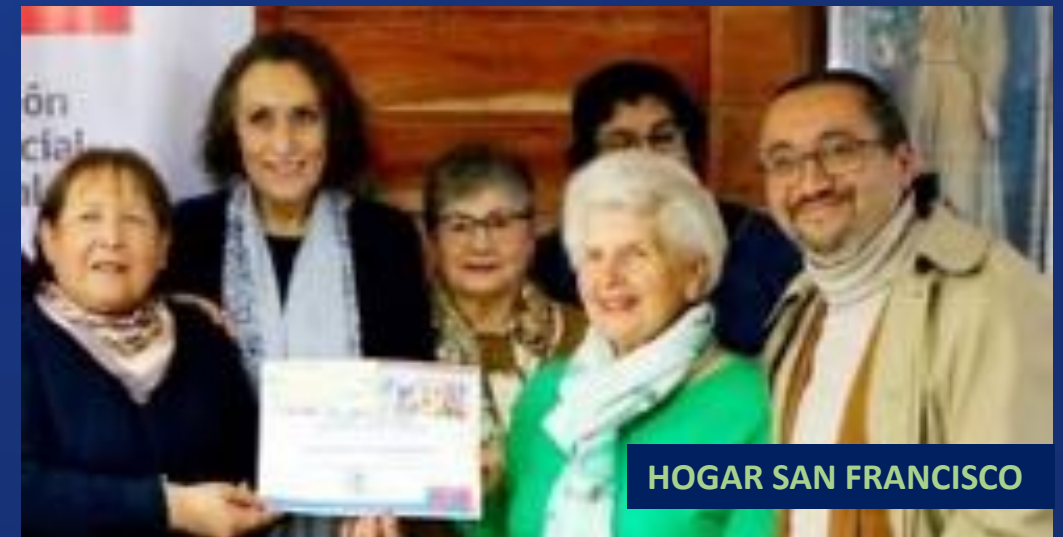
HOGAR SAN FRANCISCO