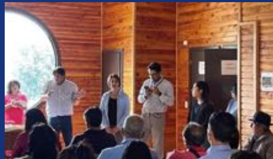
REUNIONES SOBRE LOTE C - FUTRONO