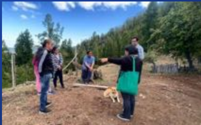
VISITA A TERRENO EN CAMINO INDÍGENA – LLANCACURA NORTE – LA UNIÓN