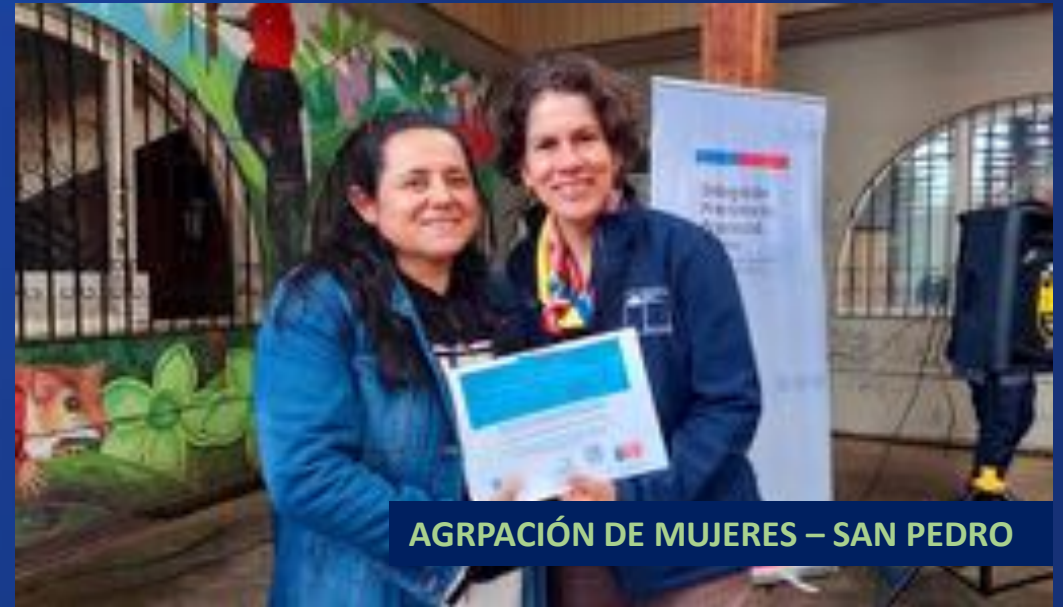
AGRUPACIÓN DE MUJERES – SAN PEDRO

TOTAL AYUDAS SOCIALES EXCEPCIONALES: 300